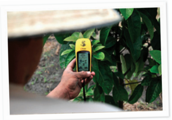
Neil Palmer (CIAT)

A menudo, junto al dispositivo de recopilación, se necesitan componentes hardware adicionales, como las herramientas de GPS. Es necesario implementar una combinación de software y servidores backend - fácilmente accesibles hoy en día- para el acceso y la visualización eficaz de los datos.