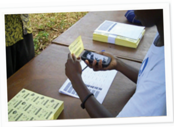
Catholic Relief Services

A nivel de políticas nacionales, la recolección de datos en gran escala puede tener un impacto masivo. La Fundación Grameen , a través de su programa Community Knowledge Worker , se asoció con una minería de datos de la NASA y con Palantir (en diferentes momentos) para explorar y analizar datos, encontrando varios datos sobre los modelos de conducta de los agricultores. Utilizando matrices («heatmaps»), también investigaron mediante búsquedas de información agrícola para identificar brotes de enfermedades de cultivos y de animales. Representaciones visuales de los datos de CKW pueden observarse en un vídeo en http://youtu.be/4FCq-EidkKc .